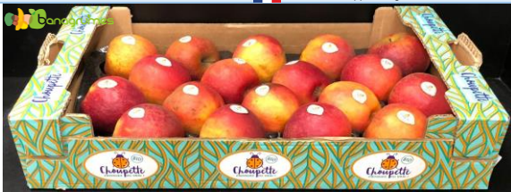
POMME CHOUPETTE BIO BLUE WHALE Cal. 18 - France