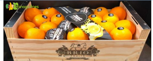
ORANGE SALUSTIANA TARDIVE BRIO Cal. 5/48 - Espagne