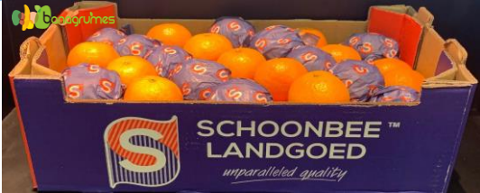
MANDARINE NOVA SCHOONBEE Cal. 1XX - Afrique du Sud