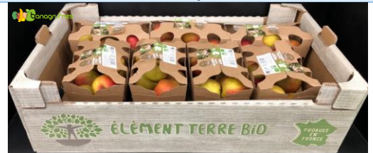
POMME DALINETTE BIO BARQUETTE 1 kg - France