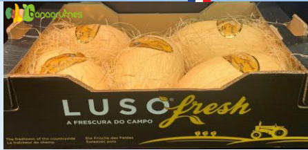
MELON BLANC LUSOFRESH Cal. 5 - Portugal