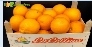
ORANGE TAROCCO BIO LA COLLINA Cal. 3 - Italie

Cliquez sur les photos pour voir la présentation Bio'Sélect