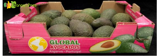
AVOCAT HASS GLOBAL Cal. 14 - Portugal

Nos Avocats sont disponibles toute l'année en "mûrs à point"