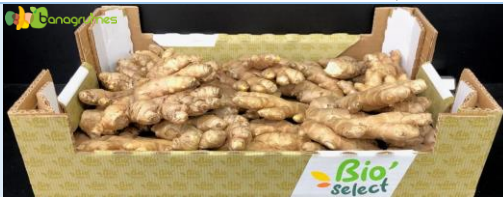
CURCUMA BIO'SÉLECT 2kg - Pérou

Cliquez sur les photos pour voir la présentation Bio'Sélect