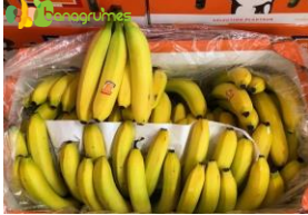
BANANE CAVENDISH OPEN TOP Class I M4 - Martinique (France)