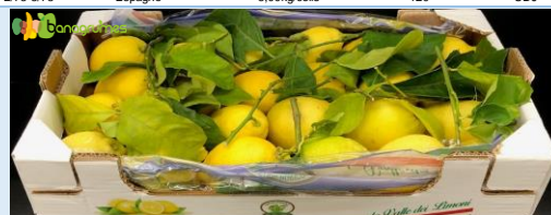
CITRON INTERDONATO FEUILLE LA VALLE DEI LIMONI Cal. 2/3 - Italie