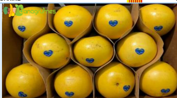
POMELO BLANC FLORIDE IMAGINE Cal. 32 - Floride (U.S.A.)