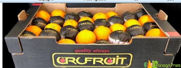
ORANGE SALUSTIANA URUFRUIT Ca. 5/64 - Uruguay