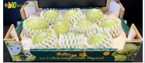
ANONE AOP CHIRIMOYA COSTA TROPICAL Cal. 10 - Espagne