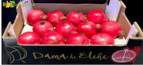
GRENADE ACCO DAMA DE ELCHE Cal. 12 - Espagne