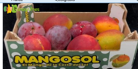
MANGUE KENT BIO MANGOSOL VRAC - Espagne