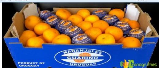
MANDARINE ORRI GUARINO Cal. 1X/70 - Uruguay