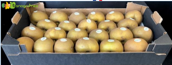
POMME CANADA BIO Cal. 23 - France