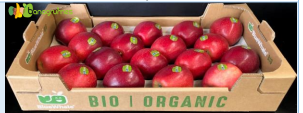
POMME GALA BIO BLUE WHALE Cal. 18F - France