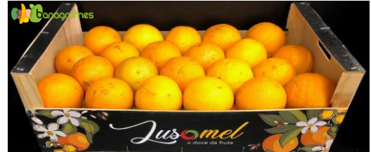
ORANGE VALENCIA LUSOMEL Cal. 5 - Portugal