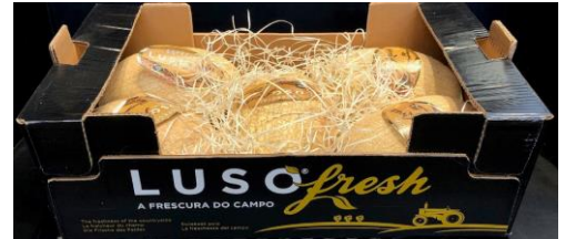
MELON BLANC PASTOR LUSOFRESH Cal. 5 - Portugal