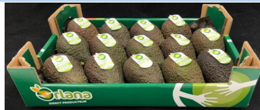
AVOCAT HASS ZRP ORLANA - Pérou

Cliquez sur la photo pour voir la présentation Orlana