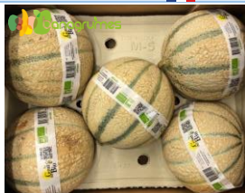
MELON BIO CHARENTAIS GOUT DU BIO Cal. 5 - France

Cliquez sur la photo pour voir la présentation Bio'Sélect