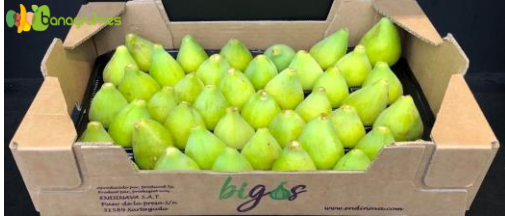
FIGUE VERTE BIO BIGOS Cal. 42 - Espagne