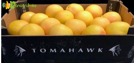
POMELO ROSE TOMAHAWK Cal. 35 - Afrique du Sud