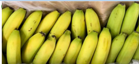
BANANE PLANTEUR CAVENDISH class I - Martinique (France)

Cliquez sur la photo pour voir la présentation Orlana