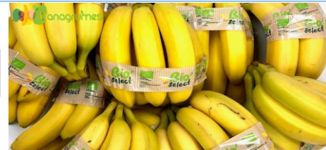
BANANE OPEN TOP CAVENDISH BIO'SÉLECT Class I - Colombie

Cliquez sur la photo pour voir la présentation Bio'Sélect