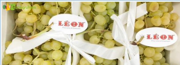
RAISIN ITALIA LEON - Sicile (Italie)