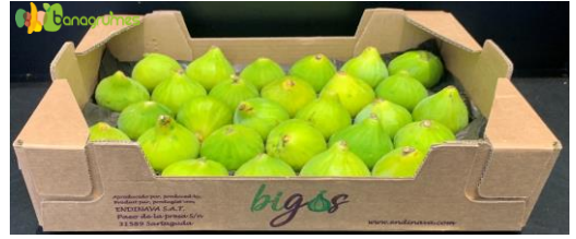
FIGUE VERTE BIO SAN ANDRES Cal. 36 - Espagne