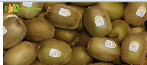
KIWI VERTE ZESPRI® BIO VRAC Cal. 33 - Nouvelle-Zélande