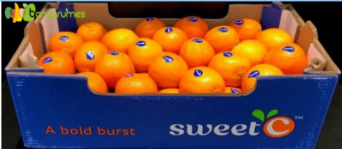
MANDARINE ORRI SWEET C Cal. 1 - Afrique du Sud