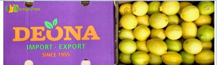
CITRON EUREKA DEONA Cal. 2/75 - Afrique du Sud