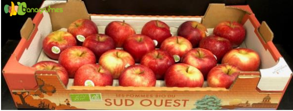
POMME BIO GALA SUD OUEST Cal. 20 - France