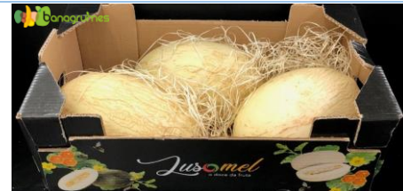
MELON BLANC PASTOR LUSOMEL Cal. 3 - Portugal