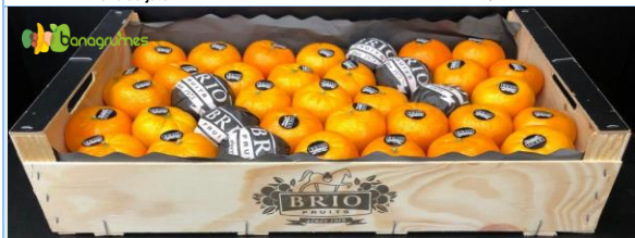
MANDARINE ORRI BRIO Cal. 2/75 - Espagne