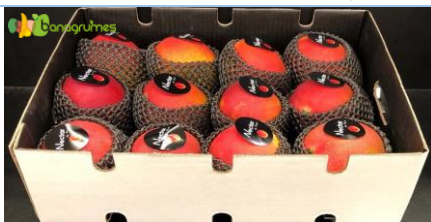
MANGUE AVION KENT NECTAR Cal. 12 - Pérou