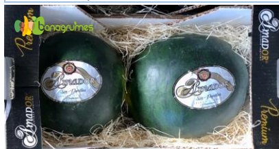
PASTEQUE SANS PEPIN NOIRE AMADOR Cat. 2 - Sénégal