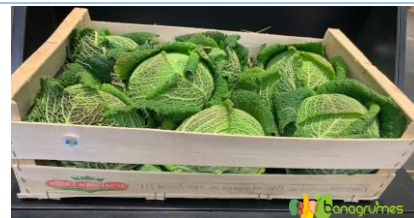
CHOU VERT PRINCE DE BRETAGNE 8 cat1 bio - France