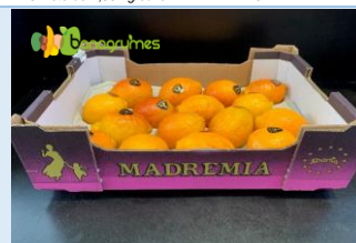
CITRON ROUGE MADREMIA 16 cat1 - Espagne