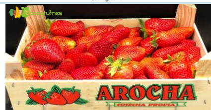
FRAISE AROCHA 2KG - Espagne