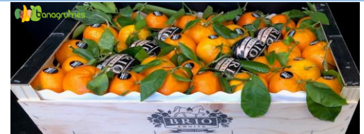
MANDARINE ORRI FEUILLE BRIO Cal. 2/75 - Espagne