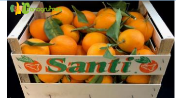
ORANGE FEUILLE NAVEL POWELL SANTI Cal. 3/5 - Sicile (Italie)