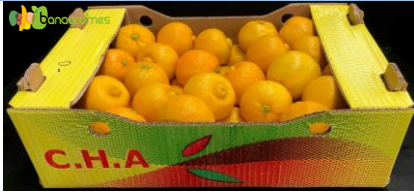
CITRON DOUX BERGAMOTTE C.H.A. Cal. GG - Tunisie