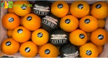
ORANGE LANE LATE BRIO Cal. 3 - Espagne